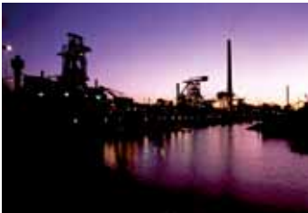
HKM Hüttenwerke Krupp Mannesmann GmbH