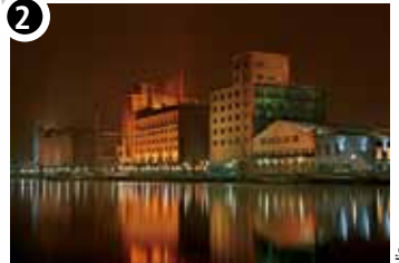
Innenhafen - Speicherzeile