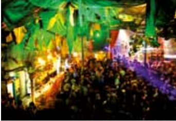
PULP - das Event-Schloss in Duisburg