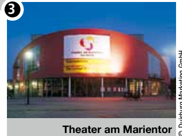
Theater am Marientor 3