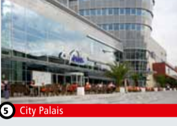
5 City Palais