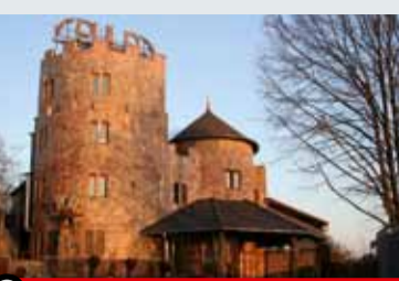
2 PUL - das Event-Schloss in Duisburg