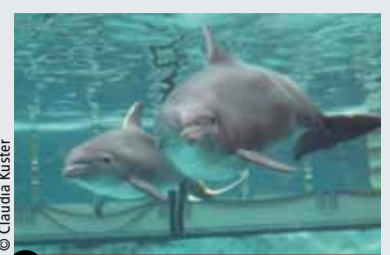
1 Zoo Duisburg