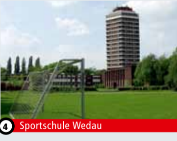
4 Sportschule Wedau